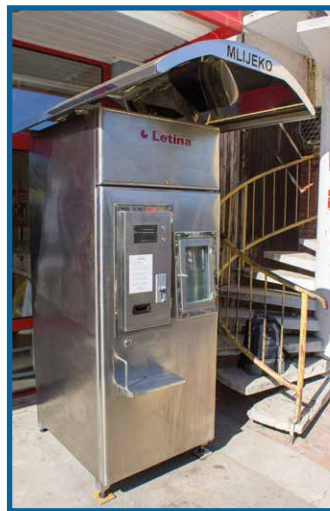
OPG Rešetar, Čakovec