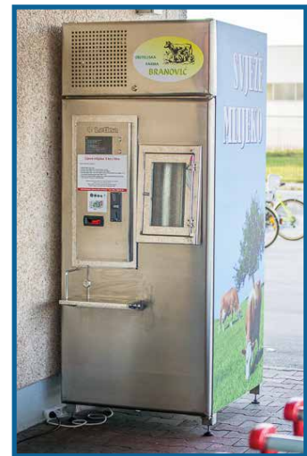
OPG Branović, Čakovec